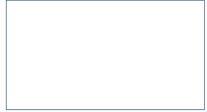
Doctor's License Number (Número de Registro)

In _____ Day _____ Month _____ Year _____. (En) (Dia) (Mes) (Año)